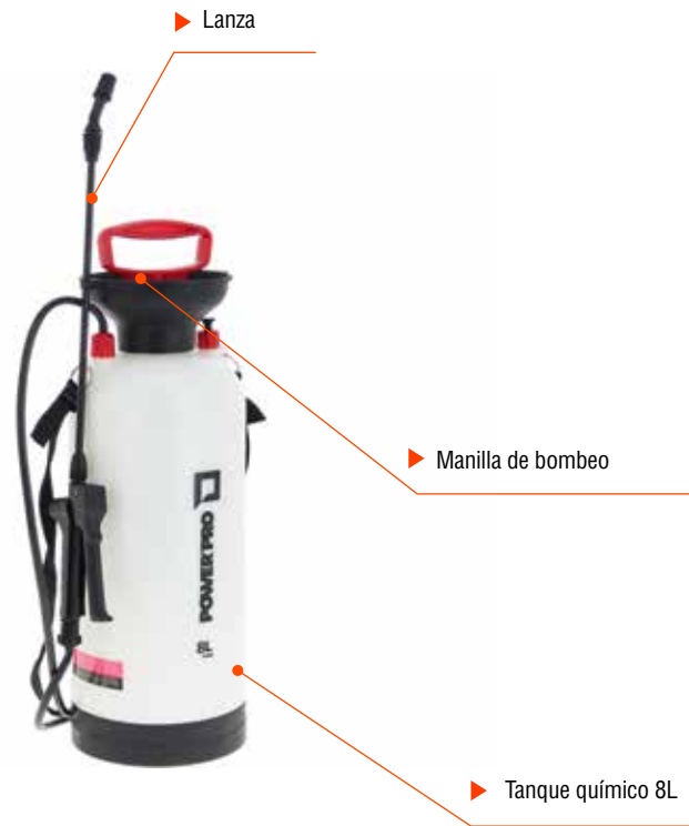
Conjunto de Bombeo