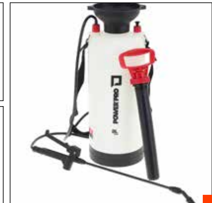
Pulverizador a presión 8L