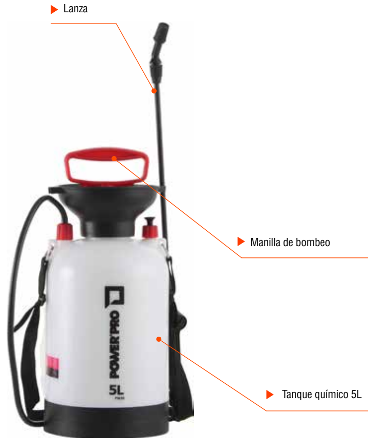
Conjunto de Bombeo