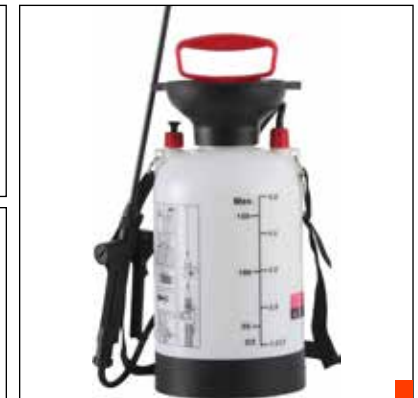
Pulverizador a presión 3L