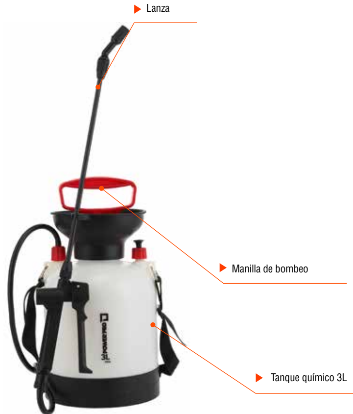
Conjunto de Bombeo