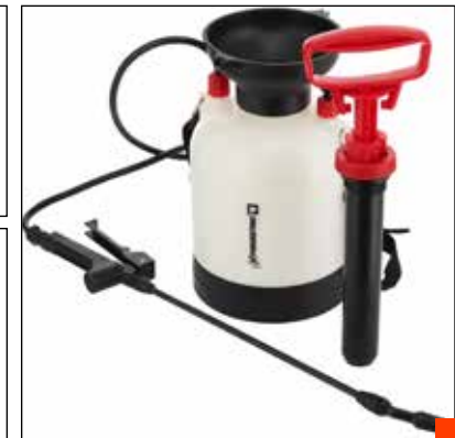
Pulverizador a presión 3L